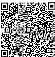
Foto fiscal f1b9de6f-ab2b-4fbc-8600-dca039214c95 RFC proveedor de certificación DIA031002LZ2 Cadena original del timbre

[1111]f1b9de6f-ab2b-4fbc-8600-dca039214c95[2018-05-23T23:46:01]DIA031002LZ2[9Gol3K1XU1+8EG5 LjYvH1ay8Y5Pj1f8h8z9ZC1yR1E9:48B9j1r2e3E5W8s0otS85Fq1del2jdosu1UgVacl640F5618GO N7M2zg00gV1ATV4ab9j5b3cc0b1Pp0v51uqNkNev7okuCoq00JulUEQ7JedLBlAVG1j1J18auNkUHX w4N5529ub6ym8558Tm8ESKORABPILC3Ag1Lac5cc7TA+76uUITSBysUPssv5ZKAHEAba0ut101RRua4Q3 c6kMFqJ6v6V9y+3jSPLh6v6j36nq0SH7j1YL1E71g1kmlYmCV0j0w6fBCTz0CQ==[000100000040 4614920]